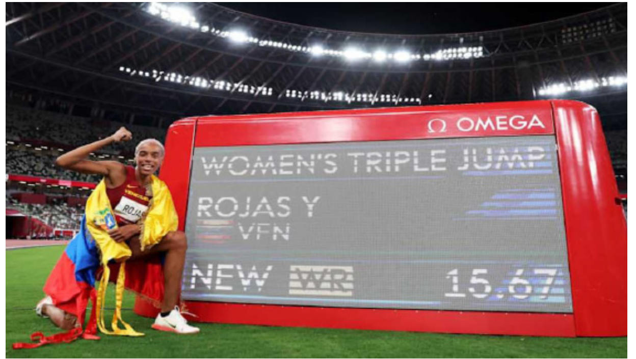
Rojas luchará por su cuarta corona de pista cubierta en el triple salto

A pesar de sus críticas, el piloto Red Bull No tiene ninguna intención de abandonar la máxima categoría, donde demuestra un talento excepcional. Realmente no quiero irme. Por el bien del deporte, esto simplemente no está bien. Por el momento, sin embargo, la FIA no parece encaminarse de inmediato a una modificación del reglamento. Por lo tanto, Verstappen tendrá que ser paciente y encontrar consuelo en sus actividades secundarias, entre la NLS y las 24 Horas de Nürburgring, para alimentar la pasión por la conducción que sigue siendo inagotable.