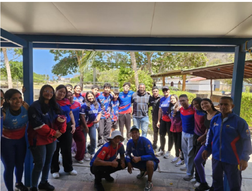
Los judocas de Aragua se concentraron en el norte de la entidad

El campamento se extendió por varios días y culminó con una última sesión de entrenamiento antes del retorno de la delegación al estado Aragua, donde los atletas continuarán su planificación rumbo a los Juegos Deportivos Nacionales Juveniles.