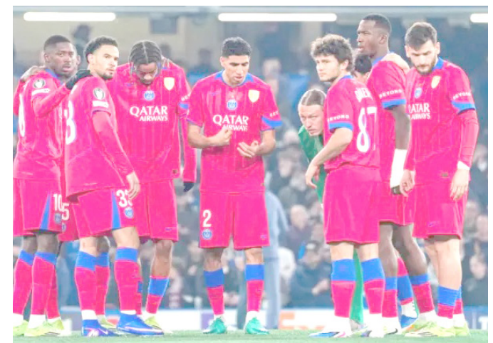
El Paris Saint-Germain hizo el trámite en Londres

Con esta victoria, el Paris Saint-Germain se clasificó para cuartos de final con un global de 8-2 y ya espera rival, que saldrá del duelo entre el Galatasaray, que parte con ventaja por el 1-0 de la ida, y el Liverpool.