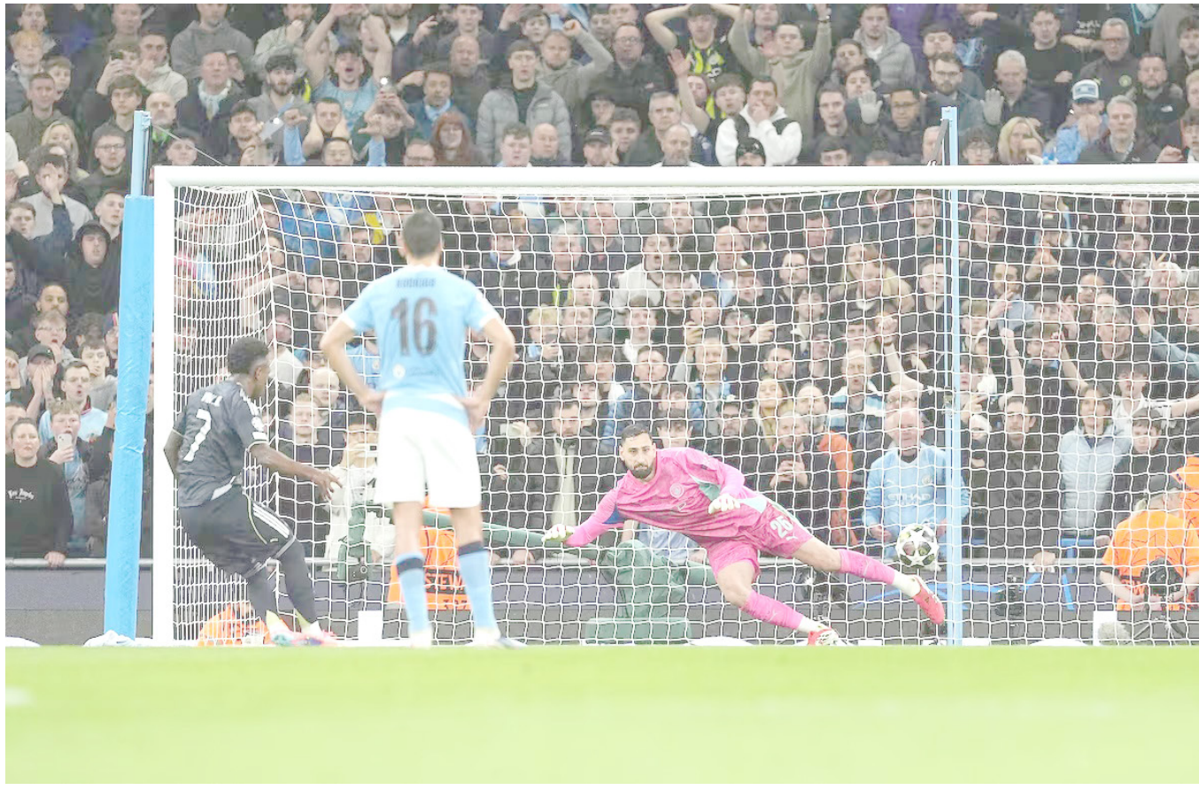
Vinicius marca de penalti su primer gol al Manchester City