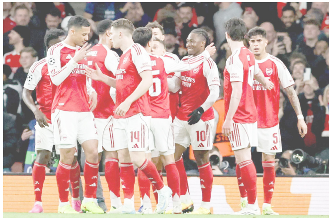
Los 'Gunnners' están por tercer año consecutivo en los cuartos de final de la Champions League

Los 'Gunnners' siempre merecieron el triunfo y la primera parte fue un total asalto a la