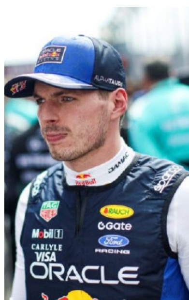
En dos Grandes Premios, Max solo ha conseguido ocho puntos

Después de comparar los coches de F1 de 2026 con “Fórmula E bajo los esteroides Max Verstappen ha adoptado la comparación realizada por su colega. Charles Leclerc en Melbourne, estableciendo un paralelismo cómico con el videojuego Mario Kart. Cambié el simulador por mi Nintendo Switch y estoy practicando un poco en Mario Kart. Encontrar los campeones me está yendo bastante bien. El caparazón azul es un poco más difícil, pero estoy trabajando en ello”.